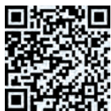
Abbildung 1 QR-Code für weitere Infos zu den Bauarbeiten an der Klappbrücke Lindaunis (= Informationen der Deutschen Bahn AG)